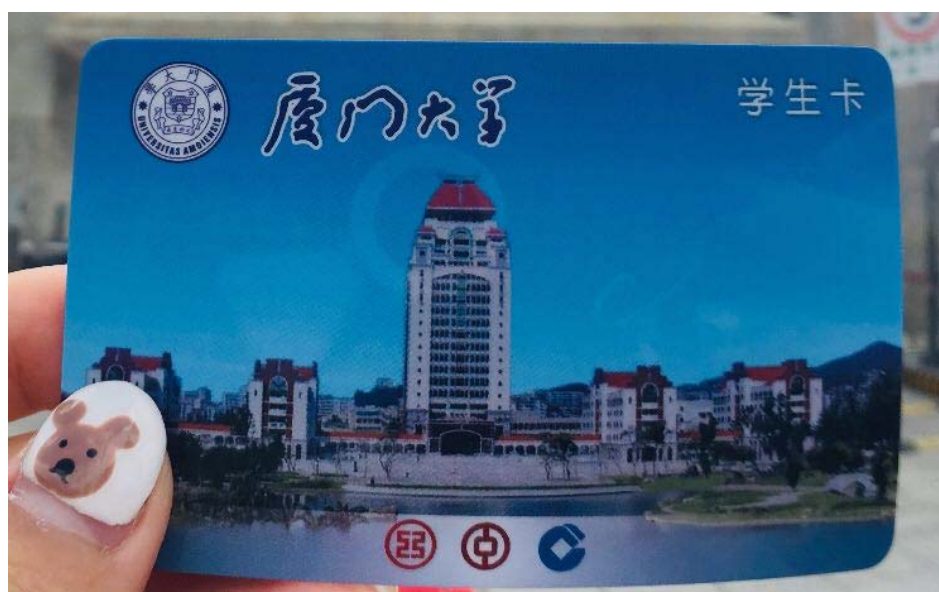
(圖二)生活必需的學生卡