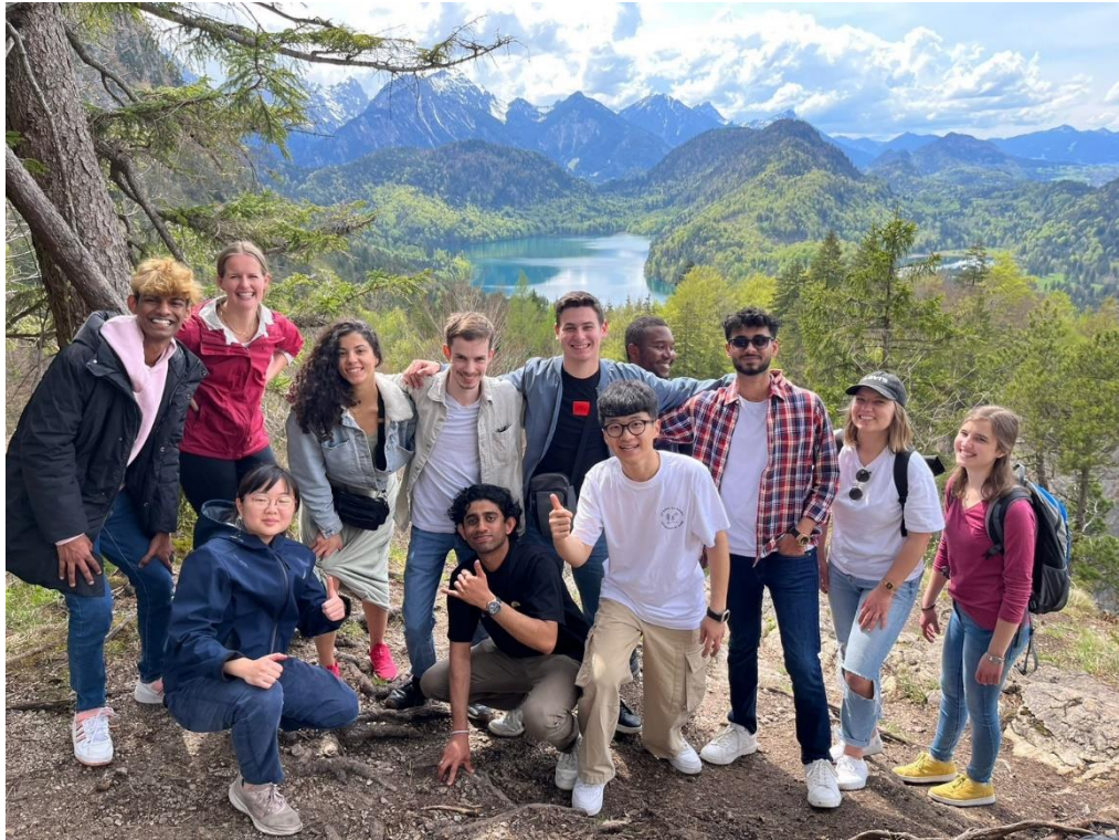
圖八 與國際生在新天鵝堡周圍風景