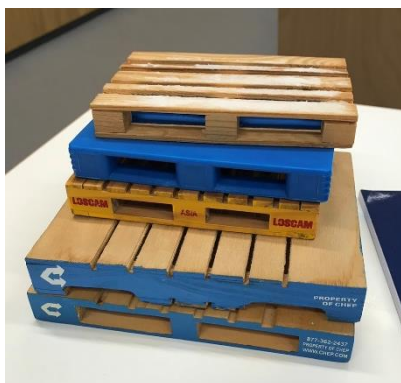
圖三 講師帶來的棧板模型

這堂課程主要在講倉儲裡面會應用到的物品，像是棧板、貨架和揀貨流程等，只有一次期末考式，課堂使用 PPT 教學，鼓勵同學發言，有安排參訪 SSI 的物流倉儲，並請公司經理到學校安排三周的行前講解，比較可惜的是因為工廠技術問題沒辦法參訪。