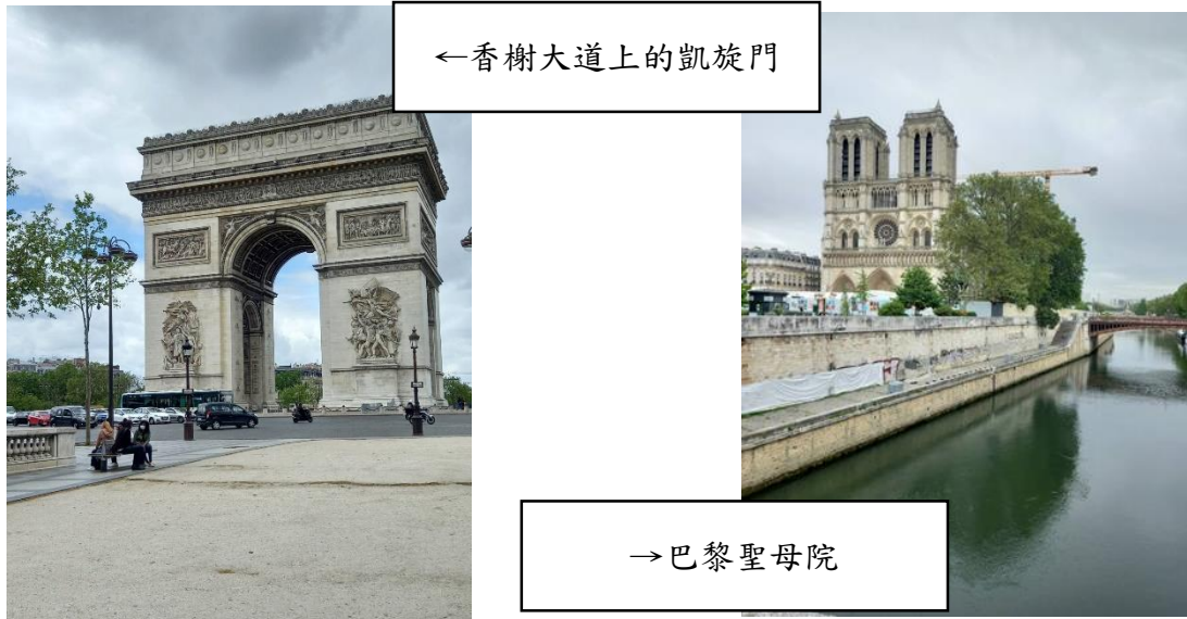
←香榭大道上的凱旋門