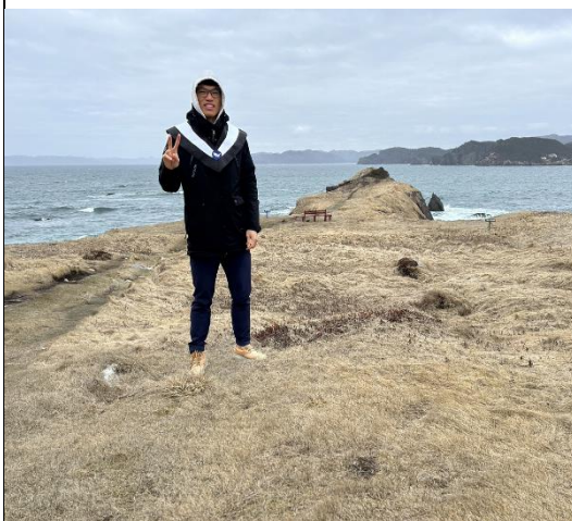
描述：ROAD TRIP 景點拍照