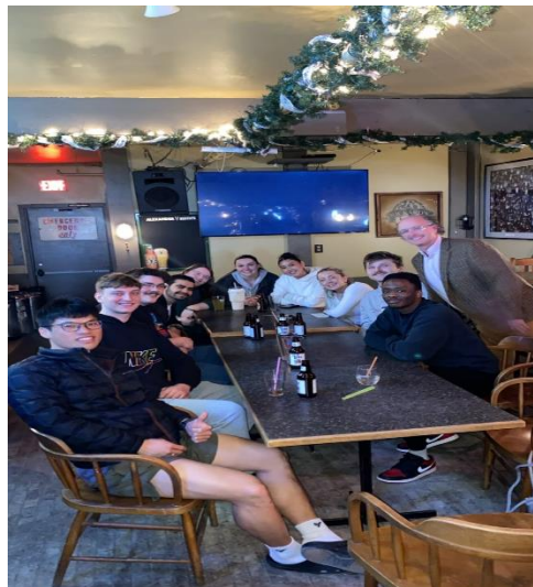
描述：在學期結束後同學們與教授 喝酒