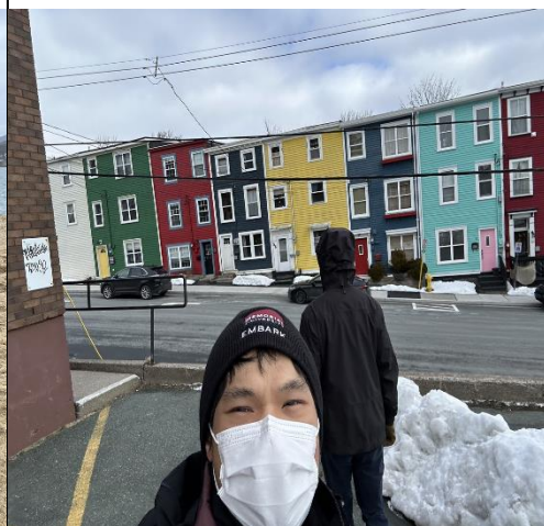
描述：與當地著名景點百年彩虹屋 合照